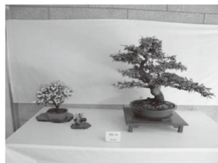
城乾市民センター教養講座発表会の様子