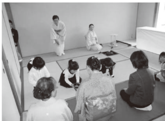
灘市民センター教養講座発表会の様子