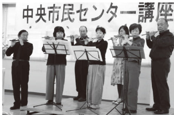
中央市民センター教養講座発表会の様子