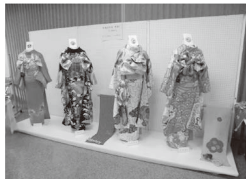
城乾市民センター教養講座発表会の様子