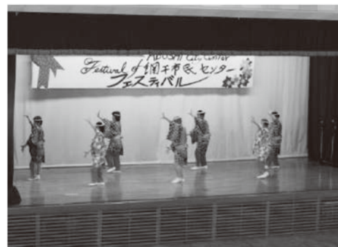
網干市民センター教養講座発表会の様子