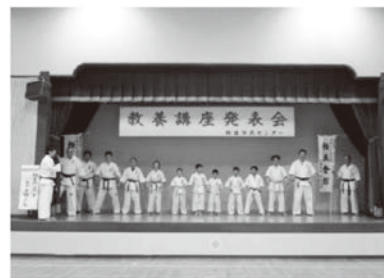
飾磨市民センター教養講座発表会の様子