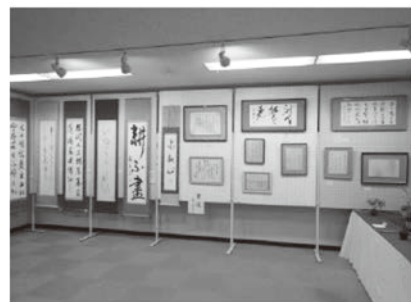
網干市民センター教養講座発表会の様子