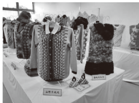
灘市民センター教養講座発表会の様子