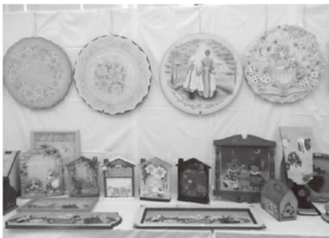
飾磨市民センター教養講座発表会の様子