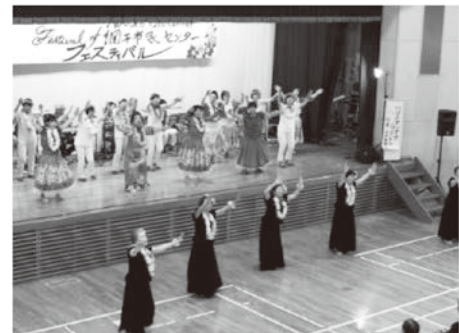
網干市民センター教養講座発表会の様子